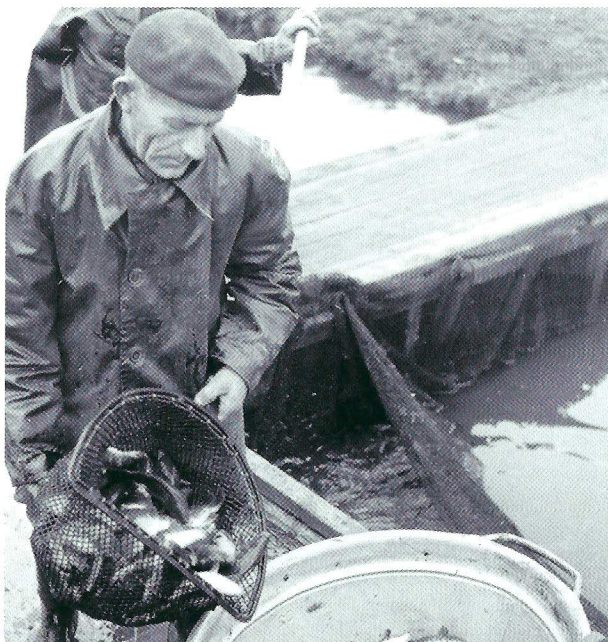
Het afvissen van pootkarpertjes gebeurde met de hand.

niet vlekkeloos. De vis wordt hier kosteloos aangeleverd, om uit te zetten in het Heegermeer en de Oudegaaster Brekken in Friesland, het Schildmeer en de Westerbroekerpolder in Groningen en het Giethoornmeer, de Beulakerwijde, het Duingermeer en de Wetering bij Ossenzijl te Overijssel. In 1902 wordt geschreven: "Het is toch niet te ontkennen dat het dure en ondoelmatige vervoer van levende visch op de Nederlandsche Spoorwegen de ontwikkeling van de zoetwatervisscherij ernstig in de weg staat." Hierna wordt een opsomming gegeven van reistijden en onmogelijk slechte aansluitingen naar het