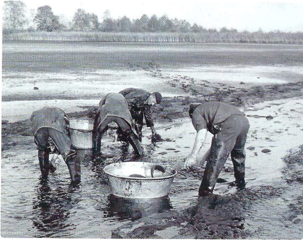
De karpers uit de kwekerij werden gevangen door het water af te laten.

de uitgezette vissen al snel uit hun wateren weg, wat door anderen afkeurend wordt omschreven als "oogsten zonder zaaien". Om te voorkomen dat de karpers worden weggevangen voordat ze tenminste eenmaal hebben gepaaid, is een minimummaat wenselijk. In 1905 belegt de Heidemaatschappij hierover een vergadering. Het voorstel om zowel voor 'inlandsche' karper als voor kweekkarper een maat van 35 centimeter aan te houden, krijgt weinig bijval. De groei van edelkarper is namelijk dubbel zo snel als de groei van inlandse karper, dus bij een minimummaat van 35 centimeter worden edelkarpers weggevangen voordat ze paairijp zijn. Omdat de geheel beschubde kweekkarper moeilijk van de inlandse schubkarper te onderscheiden is, besluit men uiteindelijk om de minimummaat voor de inlandse en de geheel beschubde edelkarper op 35 centimeter te bepalen. De maat voor de niet volledig beschubde edelkarper (spiegel- en lederkarper) wordt 45 centimeter.