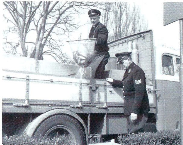
Het transport van karper in de jaren vijftig van de vorige eeuw.

In de omgeving van Vaassen is daarvoor geen terrein meer beschikbaar. Bovendien is er onvoldoende wateraanvoer